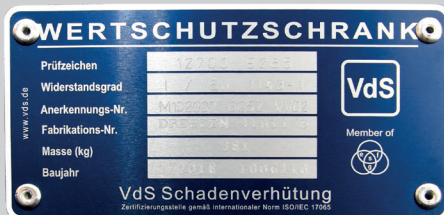
Marke der Zertifizierungsstelle VdS